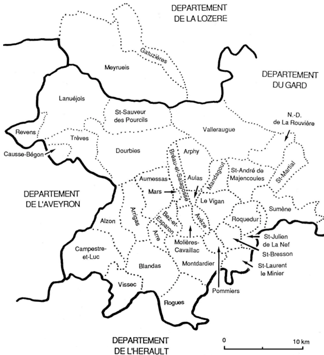
Vignerie du Vigan