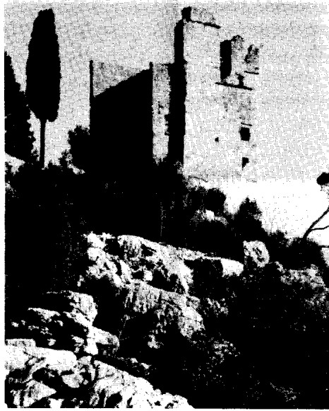
Château de Sauve

voyoit retirer, il continuoit les mesmes injures et menaces contre nous de plus il dit que sy nous retournions aud. Corconne qu'il nous en cousteroit la vie et qu'il en fera de mesme aud. de Lomelin s'il le rencontre dudit lieu mesme qu'il estoit bien aise que